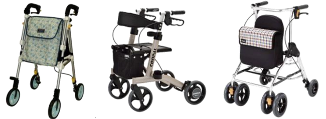
ヘルシーワンライト コンパル テイコブリトル